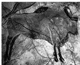
图1-1 阿尔塔米拉山洞里的野牛

但是，现代艺术家却能惊叹原始艺术的魅力，并从中获得了丰富的启示和现代艺术创作的原则。这里的问题是，不以“艺术”为目的“创作”的产品，进入了今天艺术的视域，它被称为“艺术品”的理由是什么？又如，在传统的观念中，作为艺术家个体劳动的产品，艺术品必须具备某种独创性、惟一性，而不是复制品。这是携