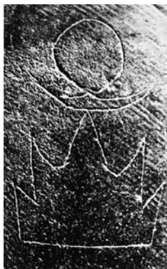
图1-2 大汶口文化遗址中的陶文符号