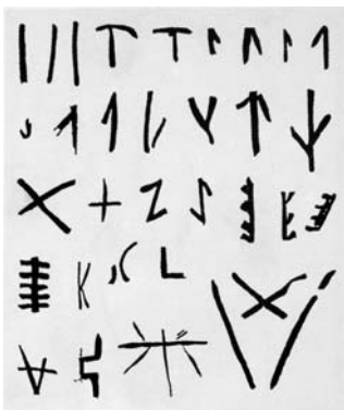
图1-1 半坡文化遗址中的刻画符号

商代（约前16世纪~前11世纪）甲骨文和金文的大量出土，表明成熟的文字体系已经形成，这些文字从章法、结构、笔法等方面显示了成熟汉字系统的显著特征。由于“唯殷先人，有册有典”（《尚书·洪范》）的说法至今缺乏实物材料的证据，所以，刻画符号与甲骨文、金文之间的过渡文字形态到底是什么样子，由于缺少文字