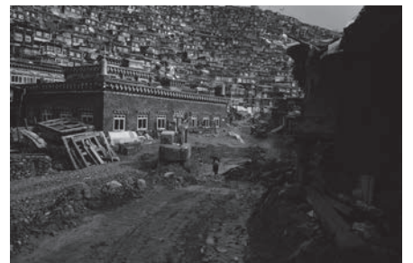
色達的道路 Roads in Tsangda