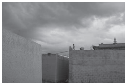
越過高牆的守望 Time of silence (Ganzi)