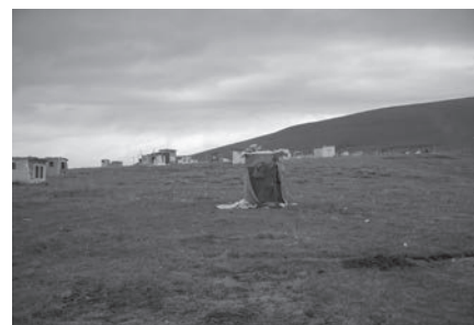
亞青苦修營 The penance camp in Yarchen