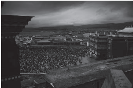
穹窿之下 Under the vault