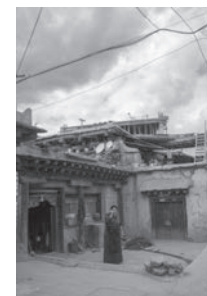
今日聽說 The lonely pedestrian