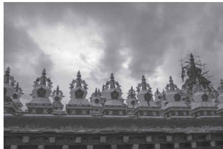
亞青塔林 Tower groups in Yarchen