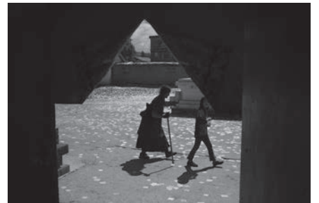
歲月的脚步 The footstep of time