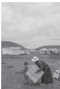
寂靜的時光 Today's story (Ganzi)