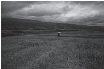
八月中旬 An angel is crossing the river (Luqu in South Gansu)