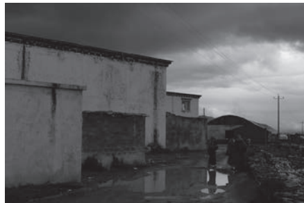
雨後 After rain