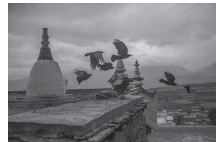
天使飛過甘孜扎西達吉羅卜楞 Ganzi Za Xi Da Ji Luo Bo Leng