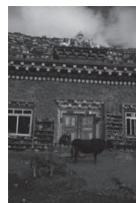
色達沉睡的門童 A sleeping doorman in Tsangda