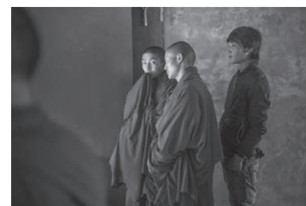
拉卜糶青年僧侶 Young monks in Labrang Monastery