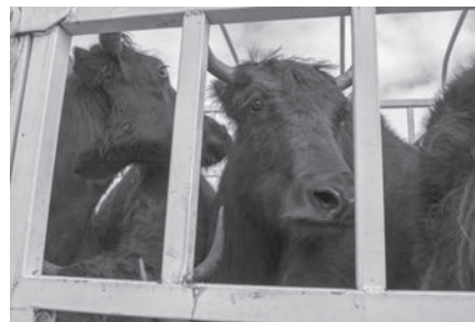
犧牲者 (甘南瑪曲) Victims (Maqu in South Gansu)