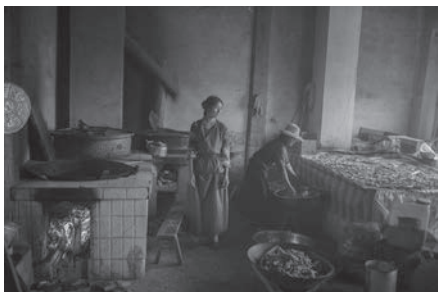
憂鬱的卡毛加 Time of silence (Ganzi)