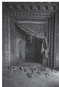
爐霍饒登朗加林寺 Lu He Rao Deng Lang Jia Lin Si