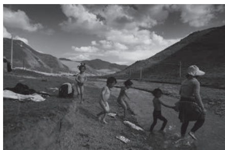
天使過河 (甘南碌曲) Angle cross the river (Maqu in South Lusu)