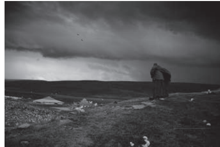
在山崗 At the hillock