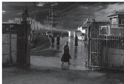
亞青殘陽 The setting sun in Yarchen