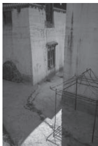
天堂一角 (阿壩) A glimpse of the heaven (Akan)