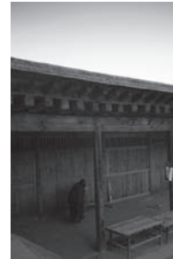
拉卜楞僧院 La Bo Leng Seng Yuan