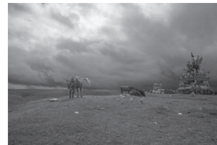
古老的秋天 (亞青) Autumn in ancient times (Yarchen)