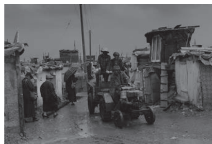
覺姆島的喧器 The noisy Jomo Island