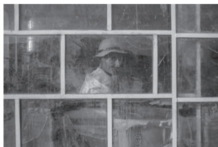
時光重圍 Curved eyes