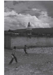
阿壩童子舞 Children are dancing in Akan