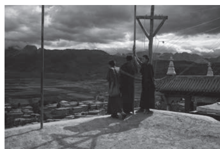
爐霍的歌聲 Singing in Luhuo