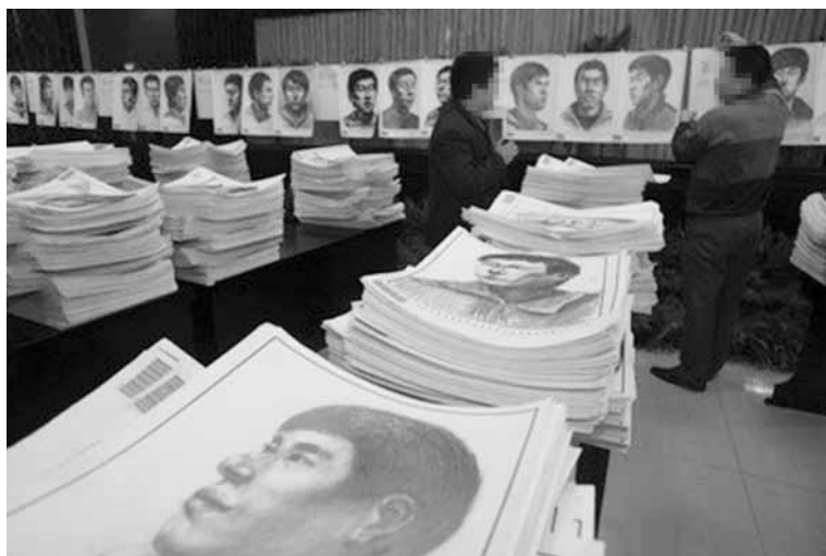
图1-1 阅卷后，考卷先被分成11个档次

以上就是联考阅卷的全过程，虽然判卷老师很认真地在批改每张试卷，但几万张试卷放在地上，总会有出现差错的时候，分档一旦定下来，分数就会被框定在一个范围，到时即使发现分在